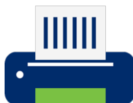
バーコード プリンター