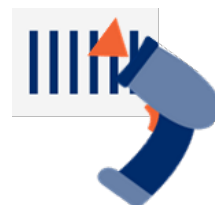
バーコード スキャナ