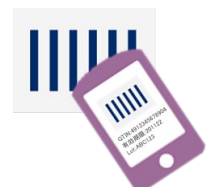
バーコード 読取ソフト