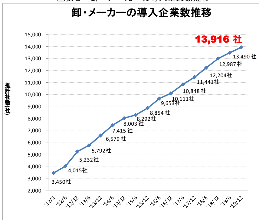
図表9 卸・メーカーの導入企業数推移

調査は、支援会員企業の中から主要な通信ソフトベンダーとサービスベンダーの協力を得て、半年毎に通信ソフトウェア出荷本数とサービス接続先数を提供してもらい、その結果から導入企業数を推計している。2019年12月1日時点の推計値は約13,916社以上となり、同年6月からの半年間で約400社近く増加している。